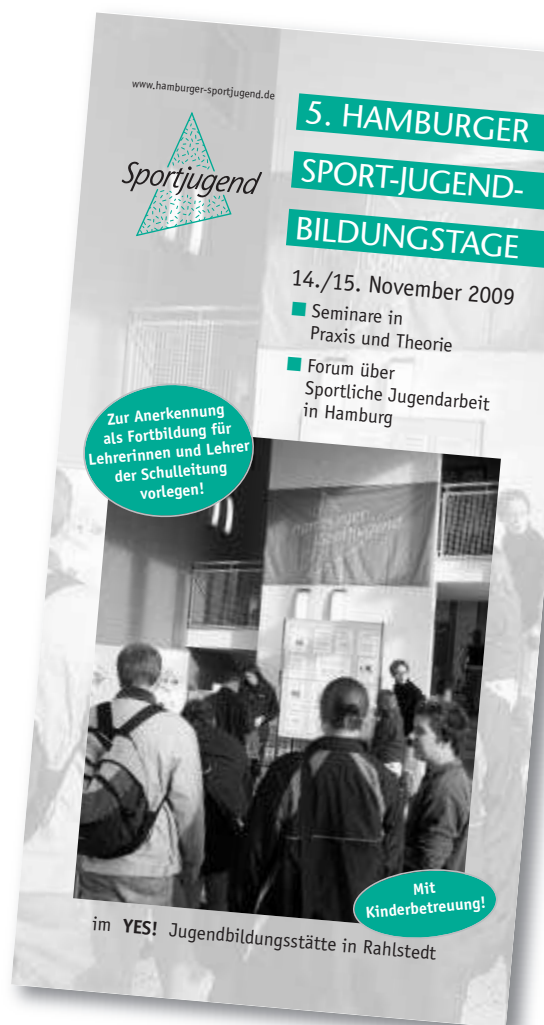
Titelseite unserer diesjährigen Informations-Broschüre zu den gerade stattgefundenen 5. Hamburger Sport-Jugend-Bildungstagen.